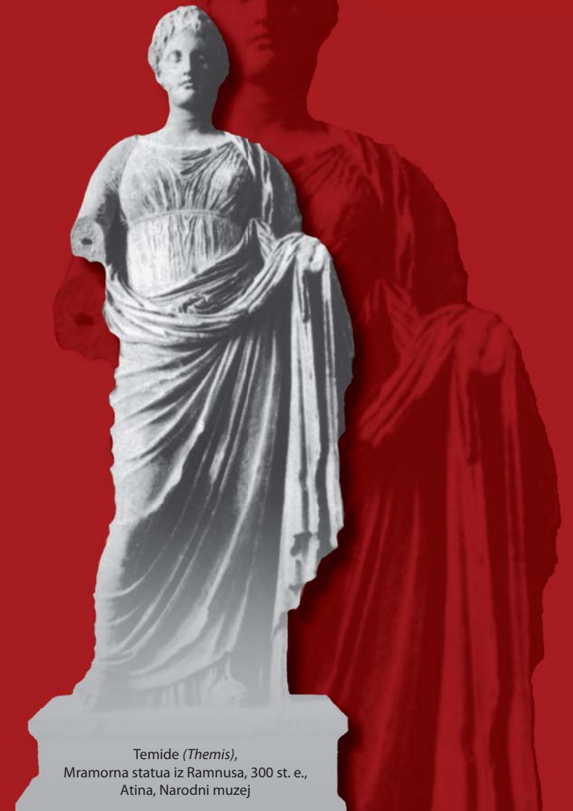
Temide ( Themis ), Mramorna statua iz Ramnusa, 300 st. e., Atina, Narodni muzej